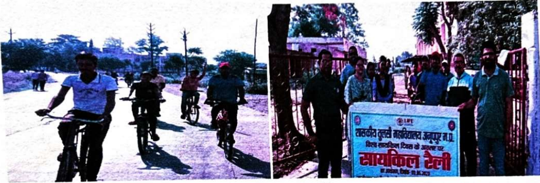
विश्व सायकिल दिवस की झलकियाँ